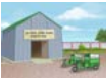
প্লাষ্টিক আৱৰ্জনা ব্যৱস্থাপনা গোট

স্বচ্ছ ভাৰত মিছনৰ দ্বাৰা (গ্ৰামীণ) নিৰ্মাণ হ'ব -