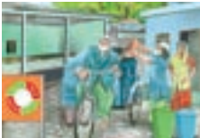
আৱৰ্জনাৰ সংগ্ৰাহকৰ উপাৰ্জন