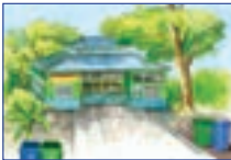
এম.চি.এফ.ৰ পৰা পৃথক কৰা প্লাষ্টিক, প্ৰতিটো ব্লকৰ প্লাষ্টিক আৱৰ্জনা ব্যৱস্থাপনা কেন্দ্ৰলৈ পৰিবহণ