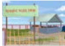
ক্ষুদ্ৰ আৱৰ্জনা সংগ্ৰহ কেন্দ্ৰ