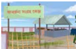
ক্ষুদ্ৰ আৰজনা সংগ্ৰহ কেন্দ্ৰ