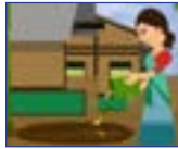
ঘৰুৱা জৈৱিক আৱৰ্জনাৰ পৰা পচন সাৰ