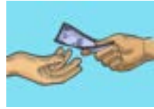
গোটা আৱৰ্জনা নিষ্কাশন ব্যৱস্থাপনাৰ বাবে মাচুল সংগ্ৰহ