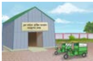
প্লাষ্টিক আৰজনা নিষ্কাশন ব্যৱস্থাপনা কেন্দ্ৰ