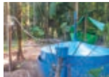
ৰাজহুৱা বায়'গেছ প্ৰকল্প