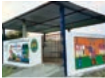
কেন্দ্ৰীয় আৱৰ্জনা সংগ্ৰহ কেন্দ্ৰ