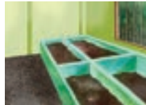
ৰাজহুৱা পচন সাৰৰ গাঁত

স্বচ্ছ ভাৰত মিছনৰ দ্বাৰা (গ্ৰামীণ) নিৰ্মাণ হ'ব -