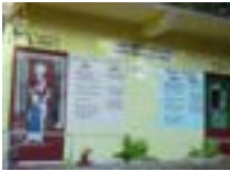
ৰাজহুৱাভাৱে পৰিচালিত অনাময় শৌচাগাৰ

গাঁও পঞ্চায়তে ৰাজহুৱা সম্পদ নিৰ্মাণ কৰিব ১৫তম বিত্তীয় আয়োগৰ আৱদ্ধ পুঁজি (অনাময়) আৰু স্বচ্ছ ভাৰত মিছন (গ্ৰামীণ)ৰ পুঁজিৰ দ্বাৰা