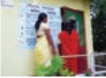
চি.এম.এছ.চি. ব্যৱহাৰৰ বিনিময়ত মাচুল- নিযুক্তিৰ সুযোগ