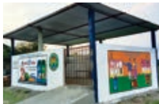
কেন্দ্ৰীয় আৰজনা সংগ্ৰহ কেন্দ্ৰ