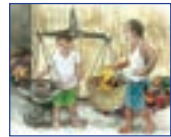
পুনৰ ব্যৱহাৰযোগ্য অজৈৱিক আৱৰ্জনা বিক্ৰী কৰিব পাৰি