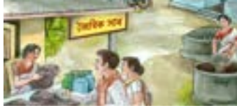
জৈৱিক সাৰৰ বিক্ৰী