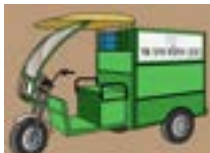
আৱৰ্জনা সংগ্ৰহ কৰা বাহন