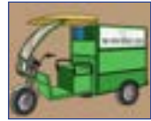
বাহনৰ দ্বাৰা আৱৰ্জনা সংগ্ৰহ