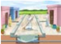
নলাৰ ব্যৱস্থা আৰু ৰাজহুৱা শোষক গাঁত