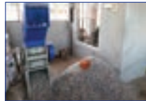
প্লাষ্টিক আৱৰ্জনা ব্যৱস্থাপনা কেন্দ্ৰত প্লাষ্টিকৰ সঠিক নিক্ষাসন প্ৰক্ৰিয়া