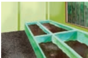
ৰাজহুৱা পচন সাৰৰ গাঁত

পঞ্চায়তৰ নেতৃত্বত ৰাজহুৱা সম্পত্তিসমূহৰ পৰিচালনা আৰু ব্যৱস্থাপনাৰ দায়িত্ব বাইজৰ