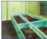
এম.চি.এফ.ত জৈৱিক আৱৰ্জনাৰ পৰা তৈয়াৰী সাৰ