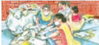
এম.চি.এফ. আৰু পি.ডব্লিউ.এম.ইউ.ত পৃথকীকৰণ কৰা লোকৰ উপাৰ্জন