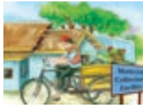
এম.চি.এফ.ৰ পুনৰ ব্যৱহাৰযোগ্য সামগ্ৰী ক্ৰেতাক বিক্ৰী