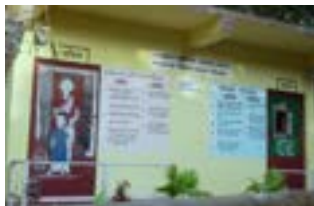
ৰাজহুৱাভাৱে পৰিচালিত অনাময় শৌচাগাৰ