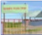
প্ৰতিখন গাঁও/ গাঁও পঞ্চায়তত আৱৰ্জনা সংগ্ৰহ সুবিধা কেন্দ্ৰ (এম.চি.এফ.)