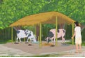
পোহনীয়া জীৱ-জন্তুৰ মল